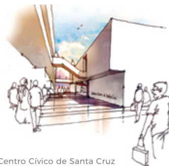
· Centro Cívico de Santa Cruz

Será sempre uma prioridade continuar a investir na preservação do património histórico-cultural, garantindo a sua reabilitação, fruição pública e potenciação turística.