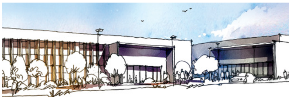
· Construção / Requalificação de Centros Educativos

Mas também os seniores encontrarão novas formas de participação na comunidade, através do voluntariado sénior. Procederemos ao alargamento do Clube Sénior e das Oficinas do Saber a todas as Freguesias do Concelho . Para os seniores será ainda criado um banco municipal de recursos lúdico-didáticos a disponibilizar em lares, centros de dia e de convívio e reforçado o apoio a projetos, a desenvolver